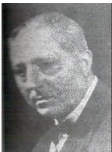
5. Irudia: Leoncio Urabayen (Arg. Estornes, 1983: 39)

Leoncio Urabayenek maisuak eta maistrak herria maitatzea ezinbesteko ikusten du; maitasun aktiboa, bizia, etorkizunaz arduratzera eramango dituen esan nahi da, ume eta gazteak diren-direnean errespetatuz garapen maila handia, onena lortzeko lagunduko diena. Besteak beste, Euskal Herriko eskoletako irakaslearen prestakuntzak nolakoa izan behar duen ere definitu zuen. Irakasleak pertsona unibertsala izan behar duela dio, ikasleak ere izateko aukera zabalduz. Horretaz gainera, maisu-maistrak formakuntza pedagogiko sakona izatea aldarrikatzen du, euskal errealitatearen ezagutzaz osatuko dena. Urabayenen ustez garrantzia handia dauka irakaslearen erosotasuna; Danimarka darabil adibide azpimarratzeko ezinbestekoa dela ondo ordaindua izatea zein bizitza eroso izatea dagoen herrian. Modu bakarra da irakasleen joan-etorria saihesteko.